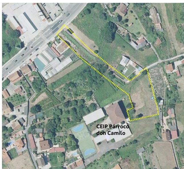
Ámbito do plan especial

Nin no ámbito nin na súa contorna inmediata, moi antropizada e transformada urbanísticamente, existen espazos naturais de especial interese. Atendendo á información do Plan Básico Autonómico, tampouco hai bens do patrimonio cultural catalogados que poidan verse afectados polo plan.