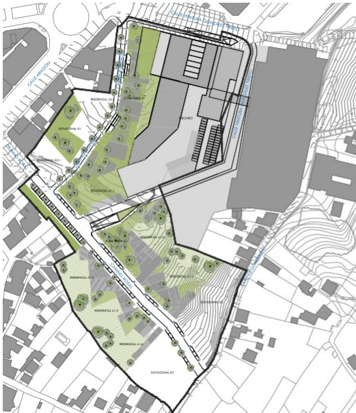
Alternativa "1" (Plano ORD.03)

Análise de alternativas: o documento ambiental estratéxico valorou dúas alternativas de ordenación para o PERI, ademais da alternativa "cero" ou de non formulación da proposta.