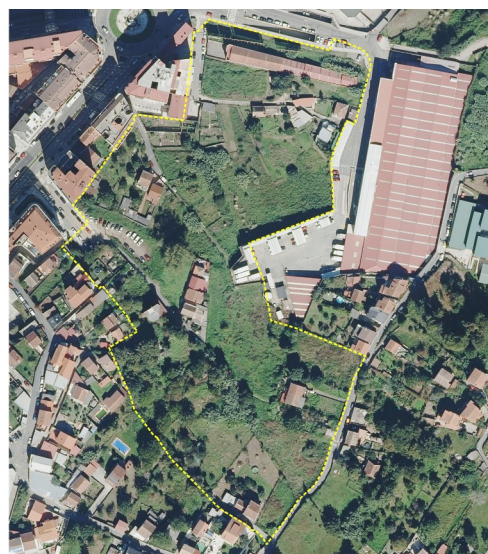
Emprazamento e situación do ámbito do PERI

Superficie do ámbito: 38.629 m 2 . A ficha do PXOM adscribe ao desenvolvemento 2.628 m 2 de sistemas xerais de espazos libres que forman parte do Paseo-Parque lineal do Lagares (SX EL PAR 033.4).