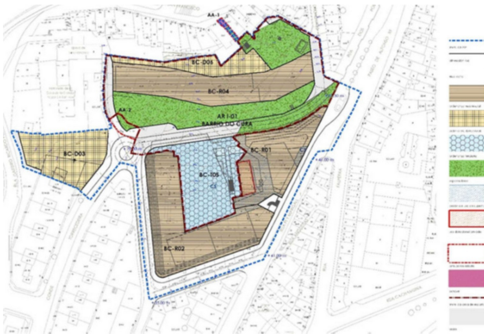
Imaxe 1 Delimitación da Área de Repartición en solo urbano non consolidado AR-1 (en liña descontinua de trazo e punto granate) sobre a ordenación detallada do ámbito da MP-BARRIO DO CURA .

Esta ordenación foi establecida directamente pola Modificación Puntual do PXOU de Vigo de 1993 para a reordenación do Barrio do Cura, en desenvolvemento das determinacións estruturantes establecidas para este ámbito de solo urbano non consolidado na correspondente ficha de planeamento