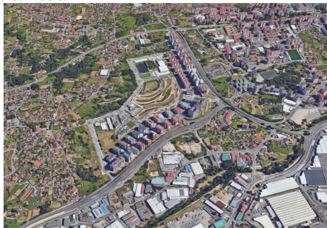
Vista área do ámbito.- fonte proxecto achegado, autoría Proyfe, SL

A modificación puntual propón para as fases pendentes de desenvolvemento urbanístico unha dotación de 22.757 m2 de zonas verdes, 23.946 m2 de equipamentos, 1.213 prazas de novos aparcamentos públicos e a plantación de 2.341 árbores, o que cumpre as reservas mínimas establecidas na LSG para todo o sector de solo urbanizable.