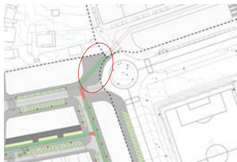
Figura 3. Perda de trazado do carril bici no encontro coa Rúa das Lamelas