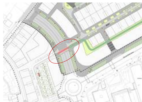
Figura 4. Perda de trazado do carril bici no encontro coa Rúa das Ufas / Padre Seixas

Este mesmo criterio sería aplicable no caso de as fases A e B no se executasen de xeito simultáneo: sempre que sexa posible, deben preverse tramos provisionais que den continuidade os peóns ou ciclistas e os permitan dirixirse cara a tramos xa urbanizados.