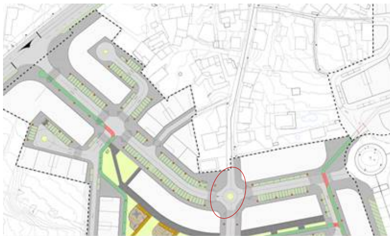
Figura 1. Rotonda susceptible de comprobación detallada para a verificación da maniobrabilidade de transportes colectivos.

Dentro do Anexo 06: Trazado refírese que o transporte colectivo local ten rutas establecidas que circulan de xeito preferente polos viais principais do ámbito. Sen contradicir esta información, compre matizar que a zona é frecuentada por transportes colectivos distintos os das liñas de autobús con paradas prefixadas o que aconsella validar que os viais de conexión coa rede principal permiten a circulación deste tipo de vehículos. Neste senso considérase que durante a execución dos traballos se debe verificar a capacidade destes vehículos para facer certas manobras, poñendo especial atención, pola súa relevancia dentro da mobilidade no ámbito, ó deseño da rotonda situada no vial de prolongación da Rúa Lamelas e que conecta coa Avenida de Europa.