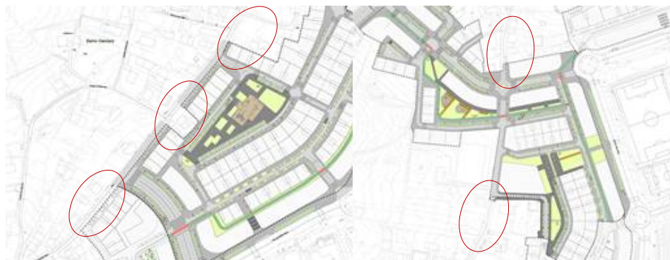
Figura 2. Identificación de zonas con perdas de continuidade na sección de urbanización da Rúa San Paio.

Á vista da documentación aportada cómpre mencionar que as labores de urbanización se restrinxen de xeito estricto ó interior do ámbito afectado pola modificación do Plan Parcial, xenerando problemas de continuidade do trazado naquelas zonas nas que se produce unha interferencia con viais existentes. No caso particular deste polígono 1, este feito faise especialmente relevante na contorna da Rúa San Paio, onde a sección de urbanización prevista non ten continuidade cos tramos da rúa que se atopan fora da ordenación do Plan Parcial. A situación referida reflíctese nas seguintes imaxes: