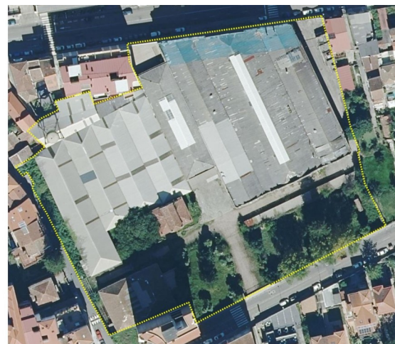
Situación do ámbito do PERI