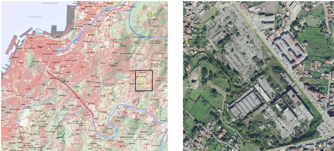
Situación do ámbito do PERI

Ámbito de actuación: terreos situados na área leste do termo municipal na zona de Barreiro (parroquia de Santa Cristina de Lavadores), correspondentes co espazo que ocupaba un complexo industrial do grupo de empresas Álvarez. O ámbito linda no perímetro norte e leste con solo urbano consolidado, mentres que ao oeste e sur o fai con solo rústico de protección de augas asociado ao curso do río Lagares.