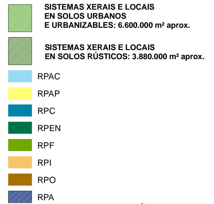
GRÁFICO Nº 19 DESENVOLVIMENTO URBANO E NATUREZA